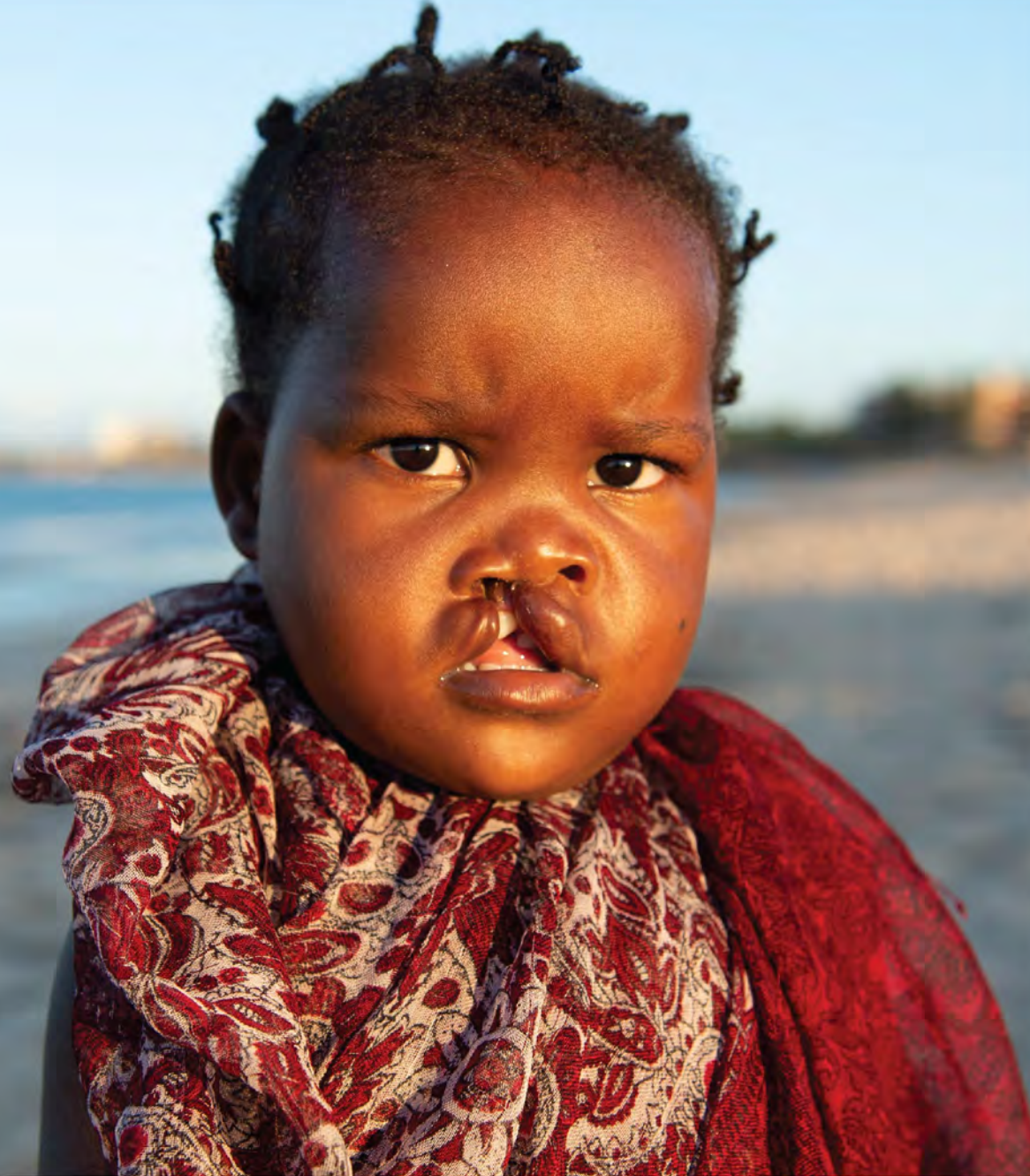
زينا ، موزامبيق

كما أننا نتشارك مع كيدز أوبيريتنج روم، وهي منظمة مكرسة لزيادة القدرة الجراحية لطب الأطفال من خلال العمل مع الفرق المحلية ل توفير غرف عمليات عالية الجودة مصممة خصيصًا لجراحة الأطفال. ونقوم معًا بتجديد وتجهيز غرف العمليات لتوفير أكثر من 30 غرفة عمليات حديثة وعالية التقنية ومجهزة للأطفال في جميع أنحاء إفريقيا بالإضافة إلى دعم التعليم والتدريب للعاملين في مجال جراحة الأطفال. وسيذهب تأثير هذه الشراكة إلى ما هو أبعد من معالجة الشقوق، بتحسين وإنقاذ حياة الآلاف من الأطفال الذين ما كان ليتسنى لهم لولا ذلك الحصول على الرعاية التي يحتاجون إليها.