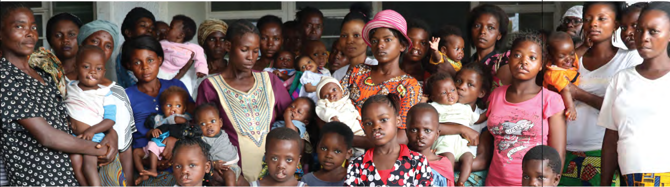
مستشفى ديومبا العام، جمهورية الكونغو الديمقراطية

في كثير من الأحيان، لا يتمكن الأشخاص المتضررون من الشقوق، وخاصة أولئك الذين يعيشون في البلدان منخفضة ومتوسطة الدخل، من التأثير على السياسات التي تؤثر على حياتهم. سمايل ترين توصل أصواتهم. وضع ممثلونا الوعي بمشكلة شق الشفة والحنك على جدول الأعمال العالمي، بما في ذلك جهود المناصرة في جمعية الصحة العالمية والجمعية العامة للأمم المتحدة. يقيم موظفونا الإقليميون علاقات مع الحكومات المحلية والشركاء لتعزيز حقوق الأشخاص ذوي الشفة أو الحنك المشقوق - وخاصة الحق في رعاية صحية آمنة وجيدة تجعل العديد من الحقوق الأخرى ممكنة، مثل التعليم والاستقلال الاقتصادي.