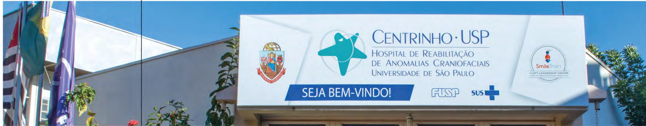
مركز سمايل ترين الرائد لعلاج الشقوق HRAC - USP Centrinho Bauru في ساو باولو، البرازيل