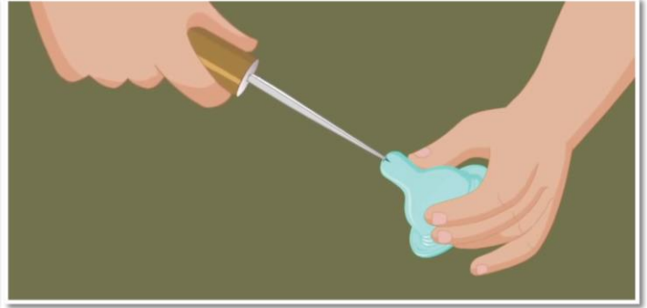
Hooyadu waxay WAXYAR waynayn daloolka uu ka jaqayo dhalada caanaha si ay u kordhiso socodka caanaha.