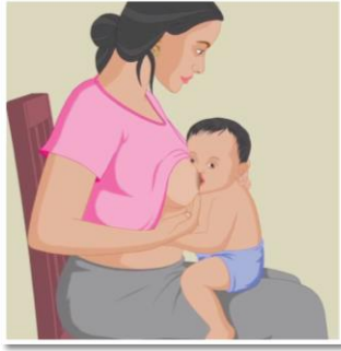
Ilmaha u quudi isga oo kor ufadhiya.