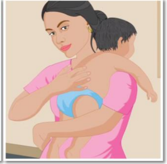
U quudi oo u dhargi carrurta in kabadan sida caadiga ah.