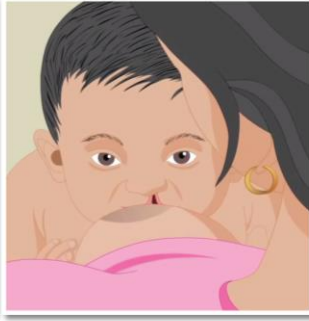
Dhig ibta afka dhinaciisa taas oo aan go'nayn.