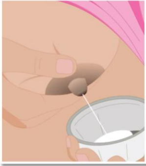
Hooyadu waxay ka lisi kartaa caanaha naaska si ay ugu quudiso cunuga qaado ama dhalada caanaha.