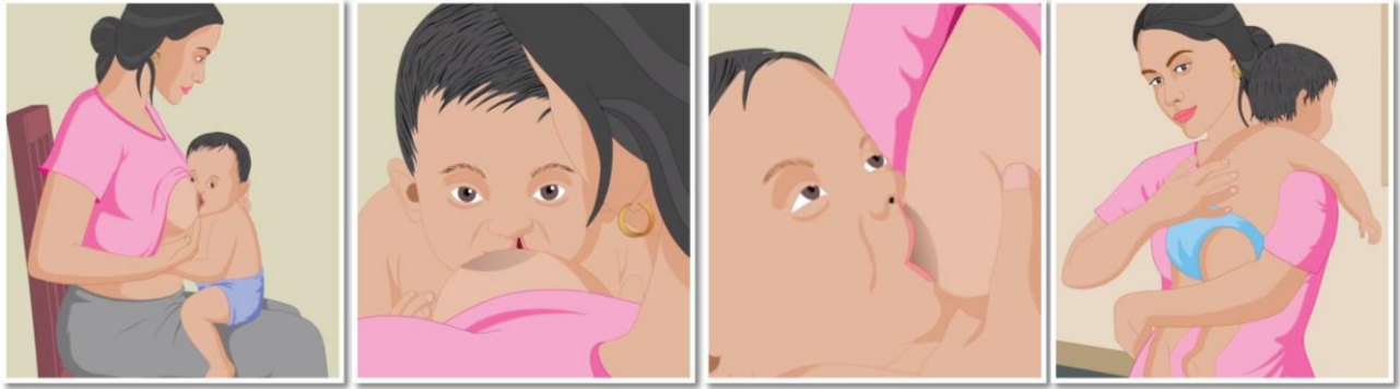
ቀጥ አርጎ በማስቀመጥ ህጻኑን ያጥቡ።

6 ቀደ ጥገናውን ለማግኘት ህጻኑ በደንብ መመገቡ አስፈላጊ ነው። እናቶች ለእርሷ ህጻን የሚበጀውን የተለያዩ የአመጋገብ ስልቶች ለምሳሌ ቁርጠኛ መሆን አለባት። ህጻኑን ቀጥታ ከጡት መመገብ እጅግ ተመራጭ ነው። ከተቻለ አንዳንድ ስልቶች እነሆ፡-