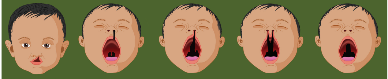
Unilateral Cleft Lip

1 कुछ धशशुओं में यह दरार जन्मजात होती है—होठ पर एक छेद, दरार या फटन या भीतरी मुख की छत पर एक छेद (जो बाहर से न ददखता हो)।